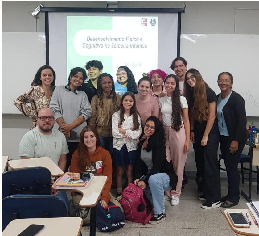
Atividade de entrevista com criança realizada em sala dia 24/05/2023.

O intuito era ouvir as demandas da criança e também a partir do encontro formular um conjunto de atividades que pudessem ser desenvolvidas com crianças por meio das equipes de trabalho. A entrevista ocorreu dentro do horários de aula na própria faculdade.