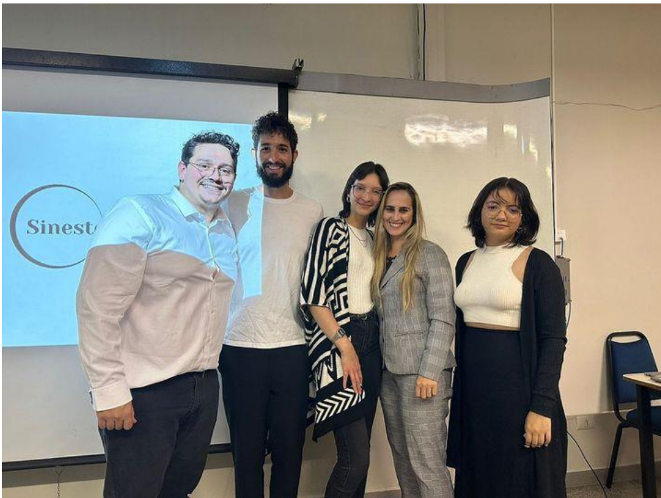
Uberlândia, Minas Gerais, 01/06/2023.